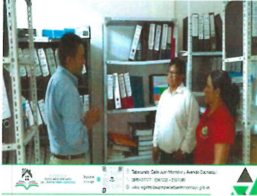
Imagen No. 5 Intercambio de Experiencias con Otros Registros