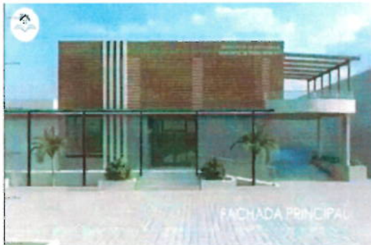
Imagen No. 1 Obtención de Recursos con el BDE para la Construcción del Registro