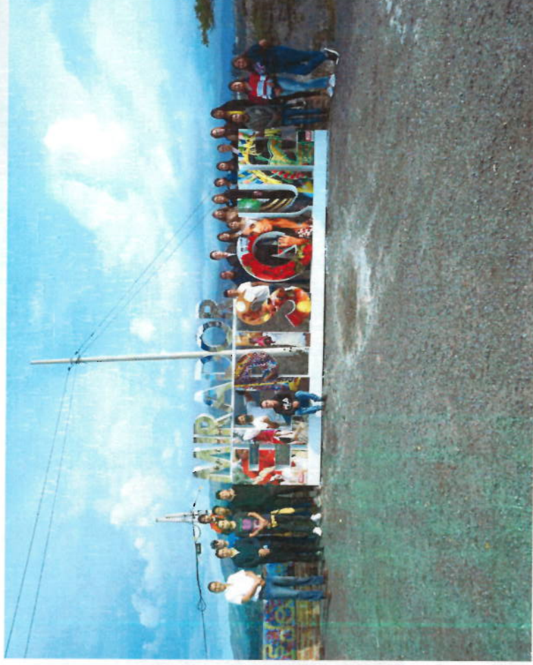
GESTIÓN DE RECURSOS PARA LETRAS DEL MIRADOR DEL PISQUE