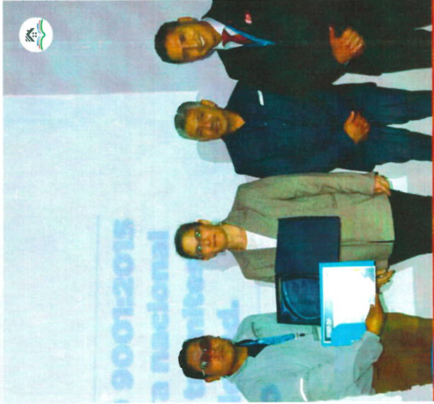
Premiación Buenas Prácticas Municipales por Gobierno Abierto en la Certificación del estándar de Calidad ISO 9001:2015