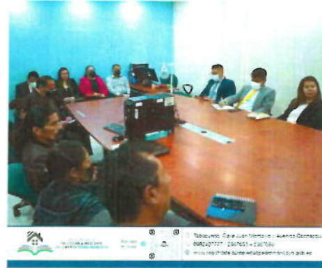
Imagen No. 6 Socialización requisitos legales con los Notarios y Abogados del Cantón