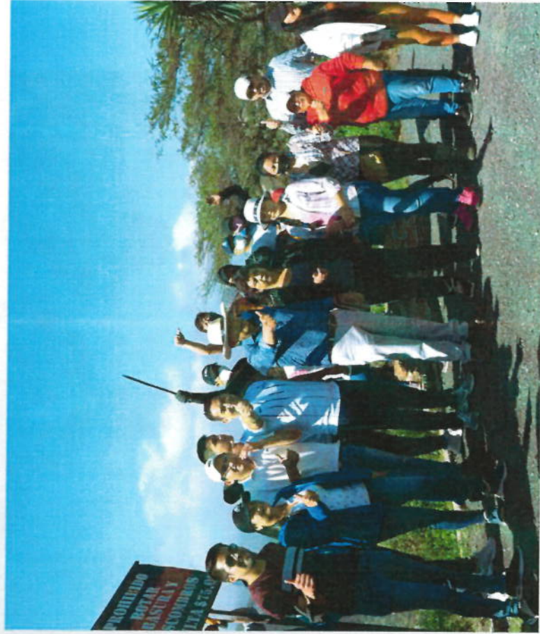
MINGA POR AMOR A PEDRO MONCAYO