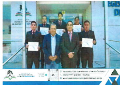
Imagen No. 2 Sistema de Gestión Antisoborno