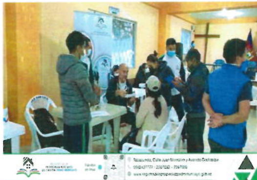
Imagen No. 3 Brigadas de Asesoría Registral en las Comunidades