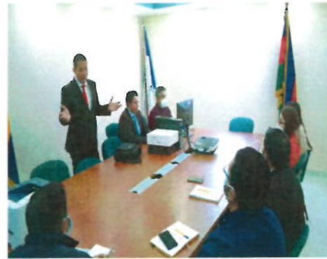
Imagen No. 4 Interconexión de la información Registral con el catastro Municipal