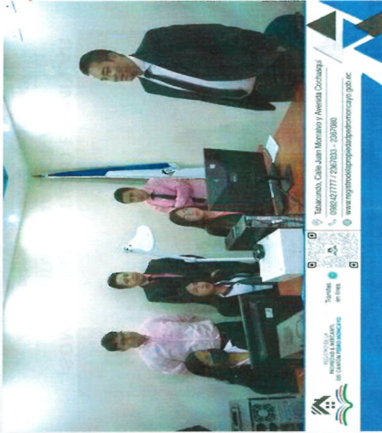
IMPLEMENTACION DEL SISTEMA SIRE

Desarrollar nuevos esquemas de auditoría informática y control de tiempos de la tecnología de información y comunicación en softwares