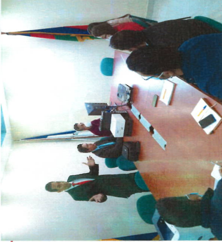
INTERCONEXIÓN DEL SISTEMA SIRE CON EL CATASTRO MUNICIPAL