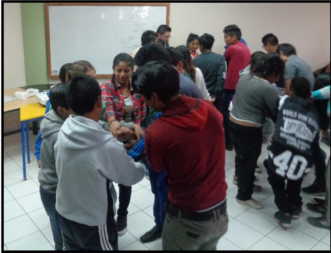
Ejercicio didáctico del trabajo en equipo durante la asamblea de Jóvenes

Otros espacios de trabajo orientados a promover y constituir los consejos consultivos de personas con discapacidad, adultos mayores, personas en situación de movilidad, están planificados para el siguiente mes.