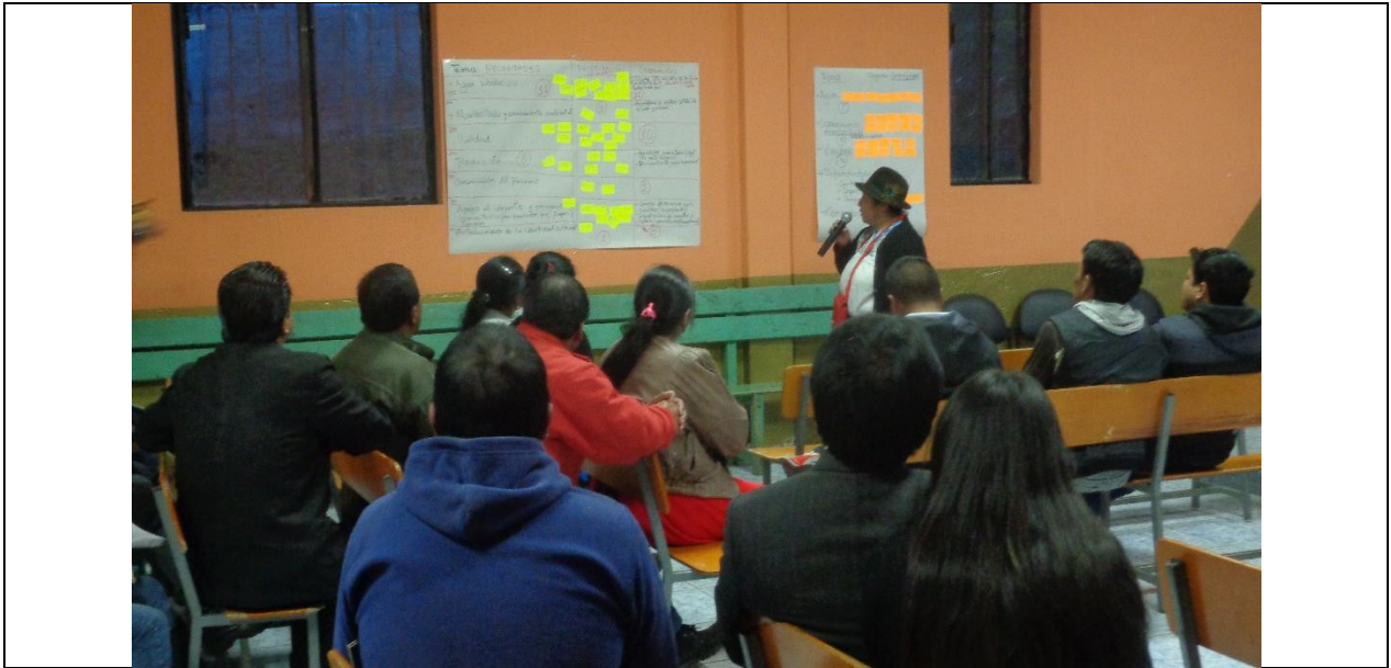
Exposición de la priorización por parte de uno de los grupos de trabajo en Tupigachi

Finalmente, es pertinente referir que, en los últimos días de agosto se ha recorrido por las 4 parroquias, promocionando y concertando las fechas para continuar con el proceso, lo cual incluye principalmente la programación de talleres de socialización de la información procesada en torno a las agendas territoriales en construcción y concertación con los Consejos de Planificación y la realización de Asambleas Parroquiales para ampliar la participación social. Estos eventos se realizarán entre la 2da. y 3ra. semana de septiembre, previo a la Asamblea Cantonal de Socialización del Anteproyecto de Presupuesto a llevarse seguramente en octubre.