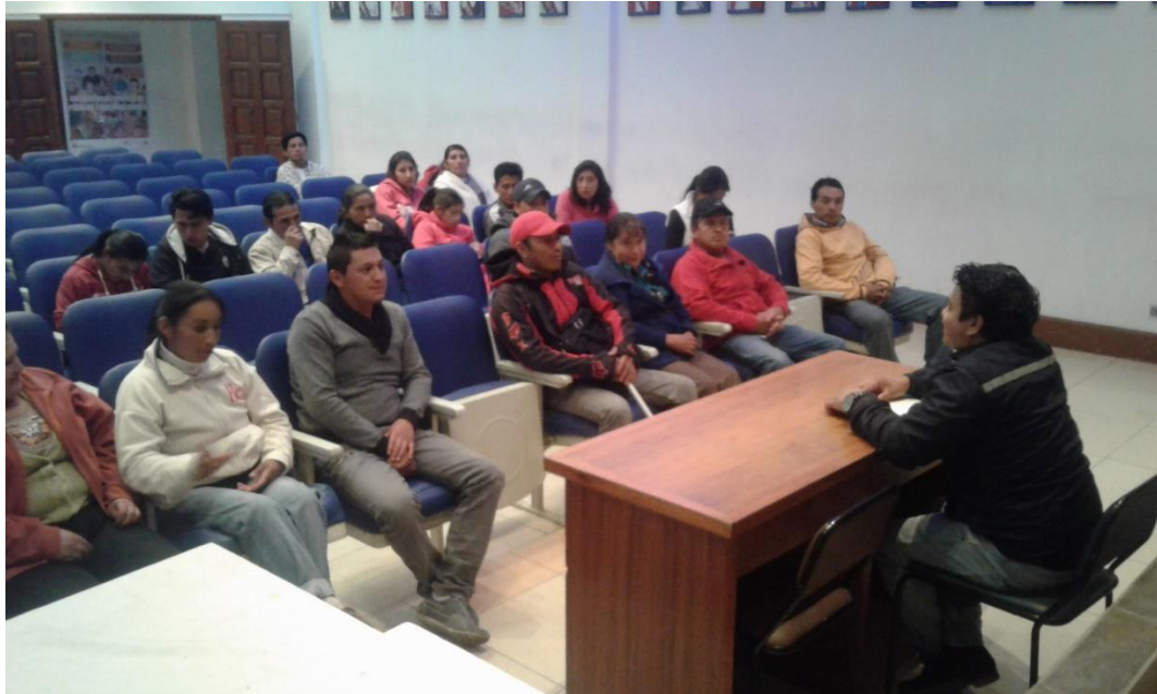
Reunión de trabajo con las/os compañeros migrantes residentes en el cantón

A la fecha, se contabiliza un acumulado de 6867 personas que han accedido y conocen de los espacios de participación ciudadana, cifra que representa el 19% con respecto a la población total del cantón, teniendo como referencia que la meta de este año se había fijado en 45% de la población total de Pedro Moncayo. De ahí que, con relación a la meta, en el resultado 1.1. se establece un avance del 42% .