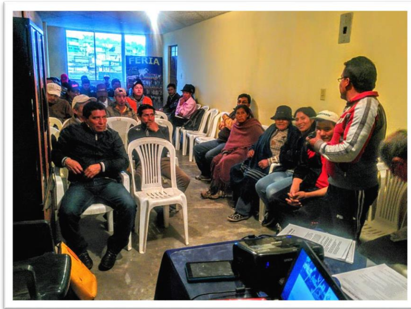
Reunión con los delegados de la Junta de Agua de Riego de Tabacundo

y Junta de Agua de Riego (Tabacundo). En estas reuniones comunitarias, se estima la participación acumulada de 998 comuneras/os.