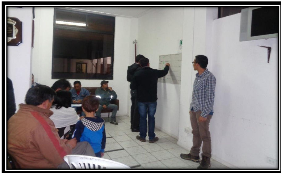
Grupo de trabajo de los barrios urbanos de Tabacundo

El ejercicio consistió en identificar en grupos de trabajo urbano y urbano-marginal y recoger los planteamientos y/o necesidades más importantes en sus territorios; una vez enlistadas en un papelote dichas necesidades, se procedió a que las/os participantes, a través de la colocación de tarjetas adhesivas, expresen el nivel de prioridad que consideran debe darse a tal o cual necesidad; obviamente se asume una mayor prioridad a aquella necesidad (agua, alcantarillado, validad, etc.) en función del mayor puntaje asignado por las personas.