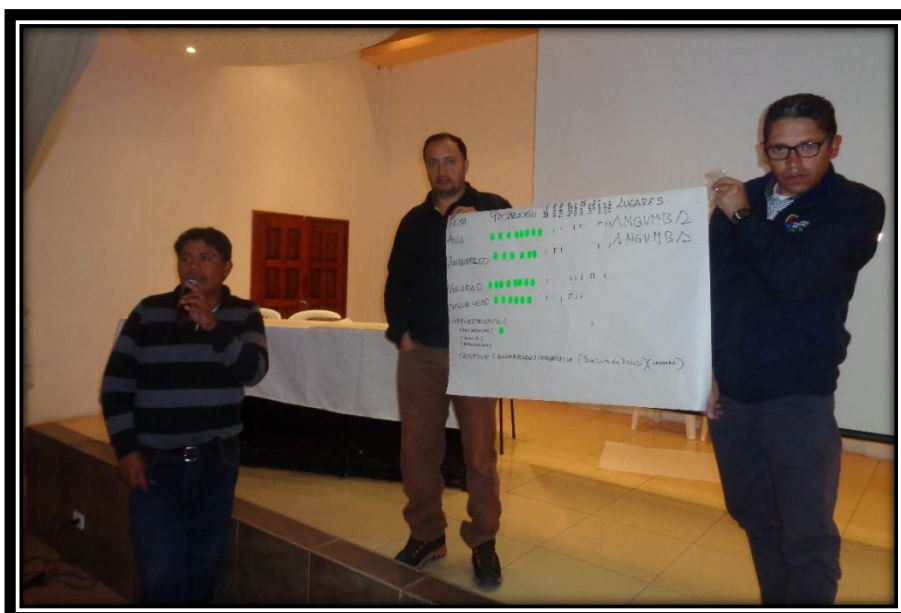
Exposición del grupo de trabajo de las comunas y comunidades de Tabacundo

El resultado de la asamblea parroquial, en el caso de Tabacundo se muestra en el siguiente cuadro resumen: