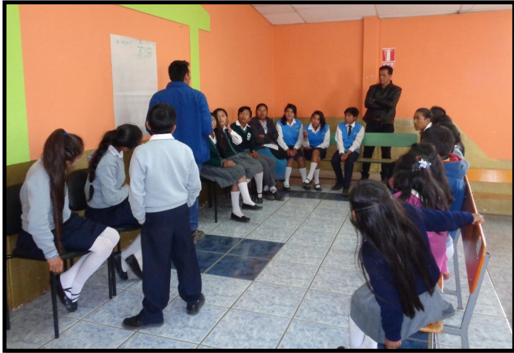
Taller de Constitución del Consejo Consultivo en Tabacundo

A la fecha, 30 de junio de 2016, que a la vez coincide con la culminación del primer semestre, cabe referir que Al momento, al 30 de junio, se contabiliza un acumulado de 4641 participantes que conocen sobre los espacios de participación ciudadana, sin considerar a las/os radio oyentes que se asume han accedido a esa información a través de las cuñas radiales transmitidas.