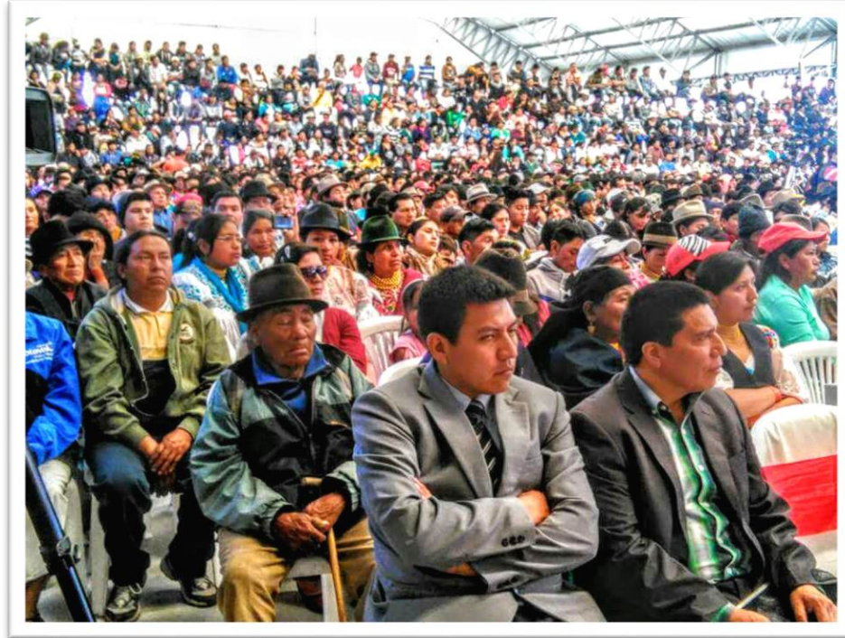
Instantes de la Asamblea de Socialización de Proyecto "Pesillo – Imbabura" en el Centro de Exposiciones de Pedro Moncayo

de crédito no reembolsable, lo cual sin duda es altamente beneficioso para los GADs Municipales y sus poblaciones territoriales.