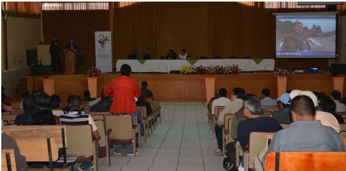
Arriba: mesa directiva; Abajo: intervención ciudadana en la Asamblea Cantonal