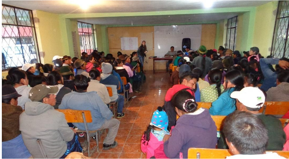
Taller comunitario acerca de los derechos en materia de las comunicaciones