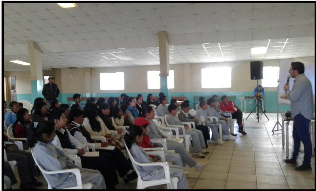
Taller de Constitución del Consejo Consultivo en Malchinguí

En otro ámbito, se ha apoyado al proceso de constitución de los Consejos Consultivos, principalmente el de la Niñez y Adolescencia. Los Consejos Consultivos Cantonales de Niños, Niñas y Adolescentes son espacios de encuentro y consulta que tendrán la misión de garantizar los derechos de opinión y participación de las niñas, niños y adolescentes en los ámbitos del quehacer nacional y local. La intención es la apertura y legitimización de espacios de participación de niños, niñas y adolescentes. Puntualmente, en estos eventos se generó la participación de al menos 100 niñas y niños.