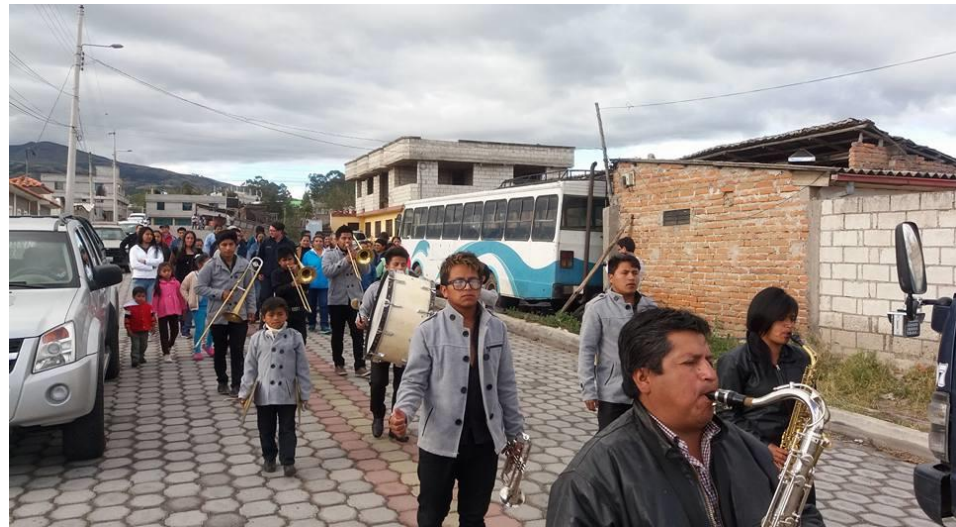
Entrega de adoquinado – Barrio La Concepción