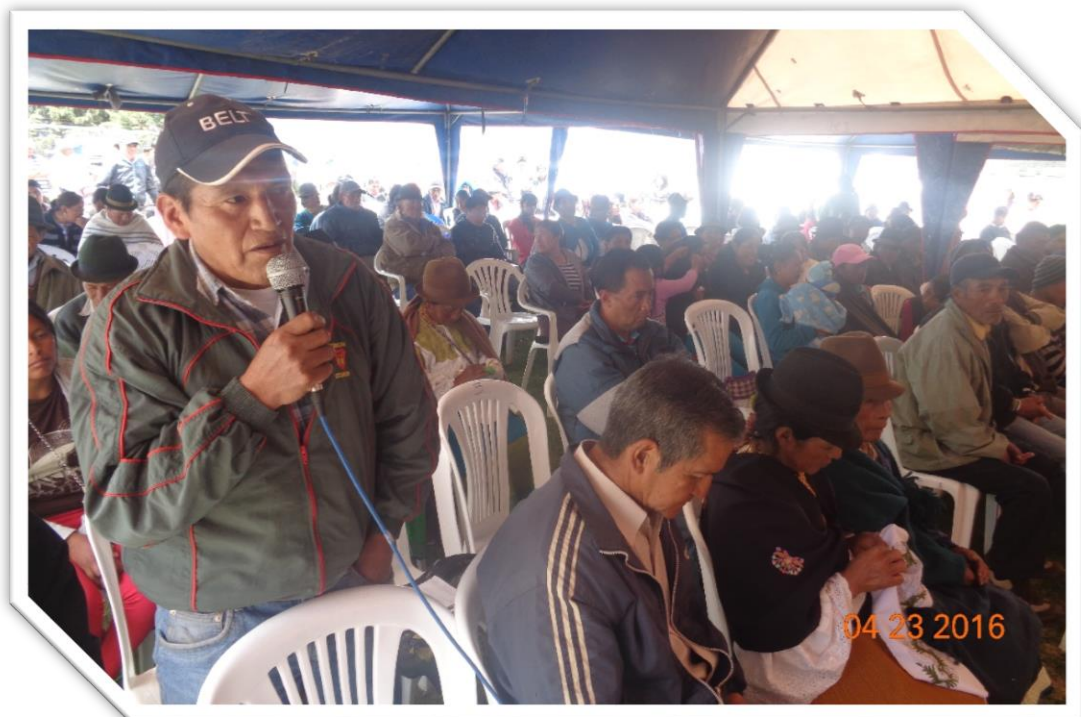
Participación de un representante comunitario de la parroquia Tupigachi en la Asamblea.