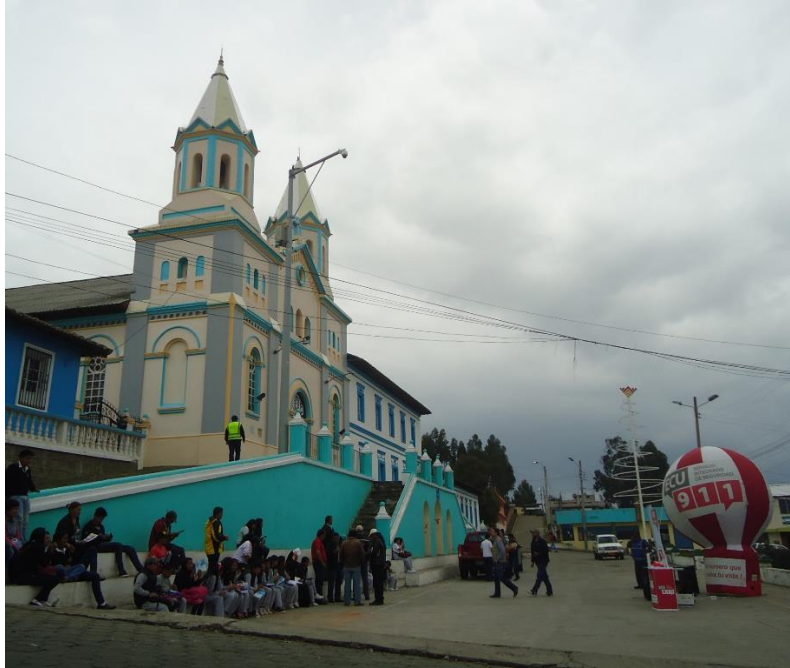
Acto de Inauguración "simbólica" de la Cámara del ECU911 en la Parroquia La Esperanza