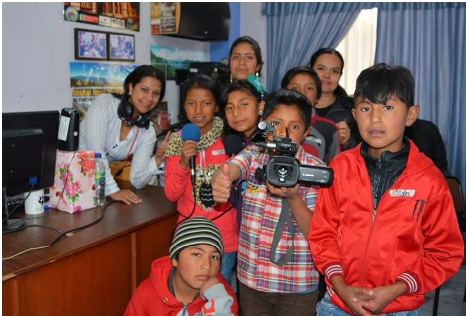
Los "Chiqui-reporteros por la Pachamama" en un momento de la grabación de las cuñas radiales.

Se señala que el trabajo también incluyó la construcción participativa de un borrador de protocolo de intervención y coordinación interinstitucional frente a la presencia de fuego en las zonas de páramos, bosquejo de las líneas temáticas y requerimientos