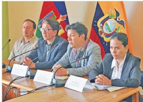
Autoridades del cantón Pedro Moncayo durante la socialización de las propuestas.

Eso ha permitido elaborar un Plan de Manejo y