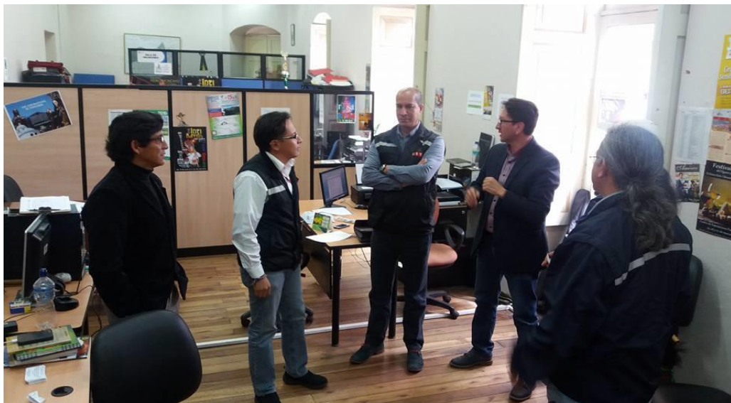
FOTO: Autoridades del ECU 911 visitaron al Alcalde del cantón.