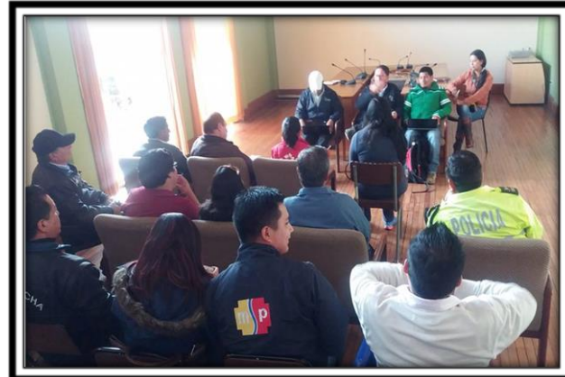
6ta. Reunión del COE: planificación de la entrega de donaciones a las zonas afectadas