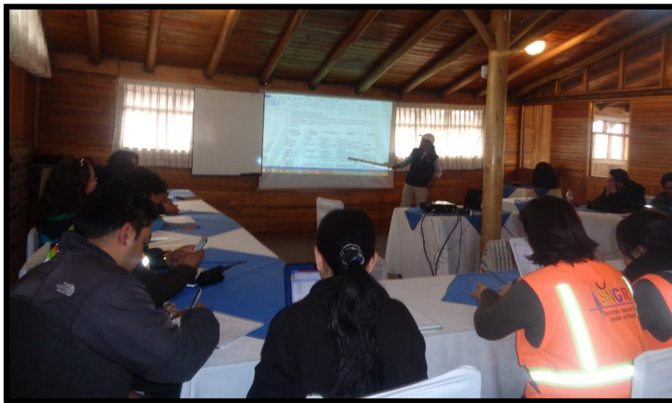
Técnico de la Unidad de Participación y Seguridad Ciudadana del GAD realizando la exposición en la reunión interinstitucional de prevención y control de quemas e incendios forestales

A propósito de actores, cabe citar y reconocer la participación y predisposición de instituciones y organizaciones/grupos sociales tales como: Cuerpo de Bomberos, Policía Nacional, Ministerio de Agricultura, Acuacultura y Pesca MAGAP, Fundación Urku Kamas, Brigadas de Seguridad Ciudadana, Jefatura Política, Tenencias Políticas de Malchinguí, Tocachi, Tupigachi, y la Esperanza, Secretaría Nacional de Gestión de Riesgos SNGR, GAD Parroquial de Tupigachi y Equipo Técnico CARE – GADM Pedro Moncayo.