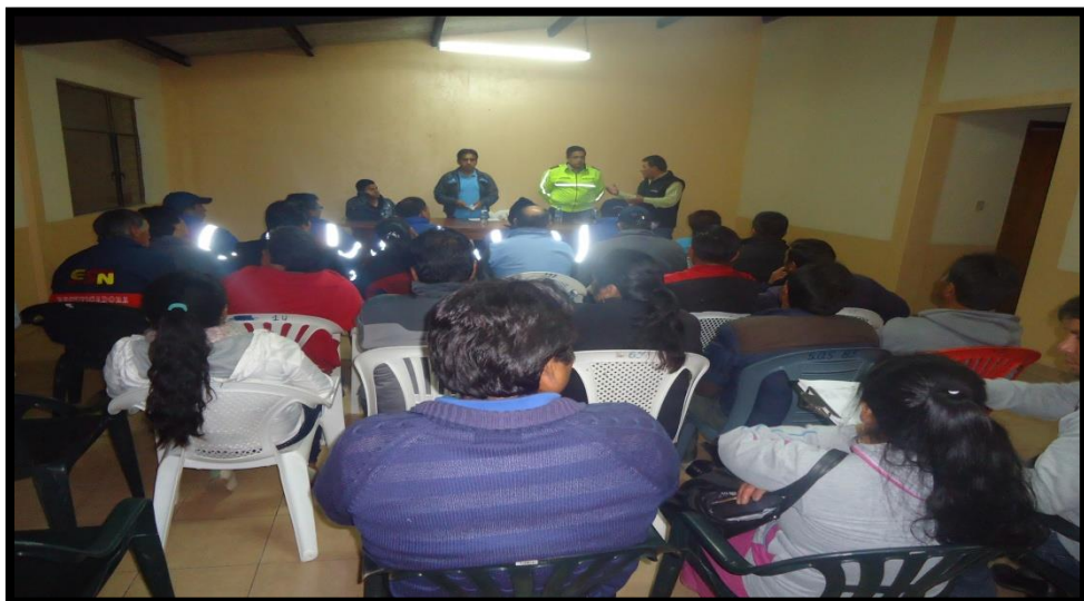
Taller en el conjunto habitacional Sumahuasi