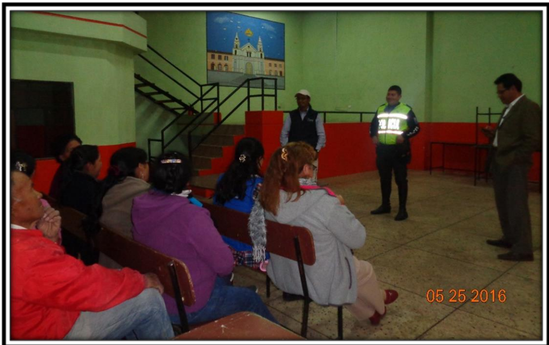
En La Playita: se suspendió el taller pero se activó los botones de seguridad