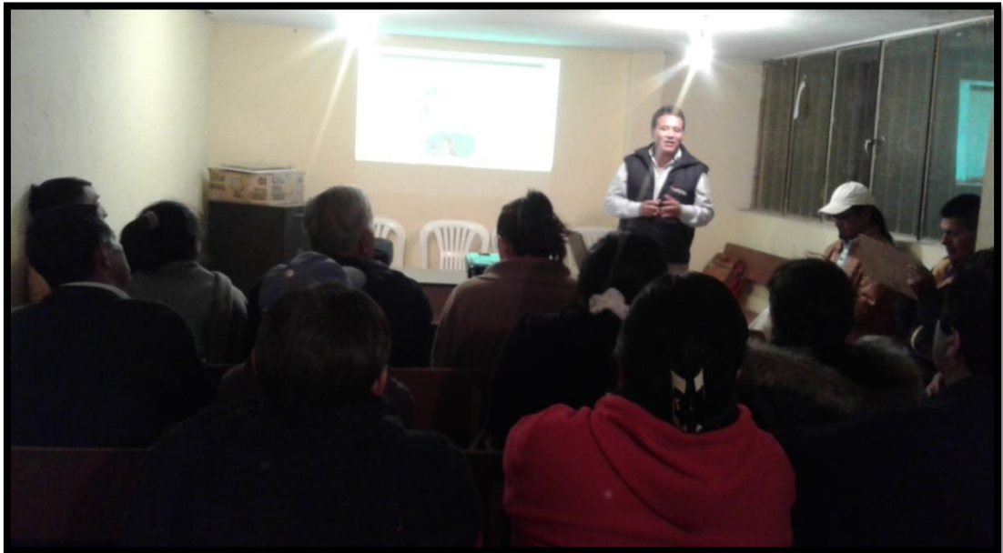
Taller en el Barrio El Chicharrón

preocupaciones sobre todo en 2 temas: el primero relacionado al caso del cadáver de un joven que habría sido abandonado en el barrio El Chicharrón y el segundo referente a la situación provocada por individuos que estarían exigiendo pagos casi diariamente por pequeños montos a las/os dueños de las tiendas o negocios. El taller se complementó con la capacitación por parte del Abg. Enrique Cisneros y la Policía que activó los botones de seguridad a algunas personas que todavía no habían tenido este servicio de la Policía Nacional.