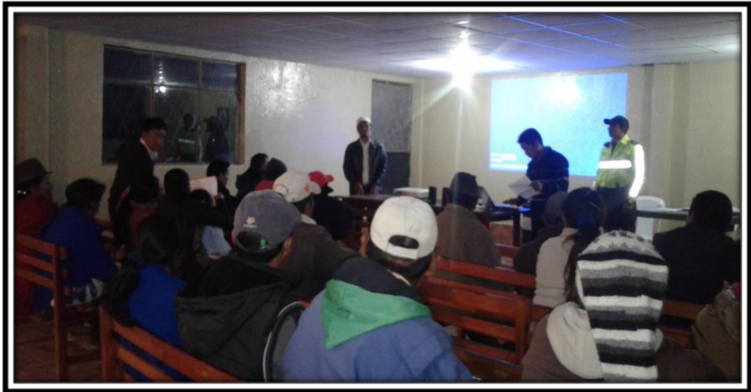
Taller de Seguridad en el Barrio La Cruz