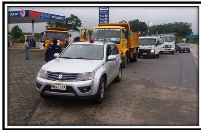
Durante el viaje hacia la provincia de Manabí