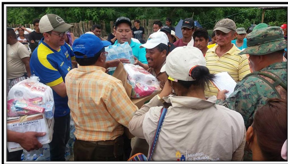
Entrega de kits de víveres y agua gracias al apoyo solidario de Pedro Moncayo

Como se evidencia en las gráficas, que expresan más que las palabras, finalmente cabe destacar el gran despliegue realizado a lo largo del periodo de recolección y entrega de donaciones por parte de las autoridades cantonales y gobiernos municipal y parroquiales, representantes institucionales del régimen desconcentrado (Distrito Cayambe – Pedro Moncayo) como los Ministerios de Inclusión Económica y Social MIESS, de Educación MINEDUC, de Agricultura, Ganadería, Acuacultura y Pesca MAGAP, del Interior y sus entidades como la Jefatura Político, Comisaría Nacional y Policía Nacional, así como también el Cuerpo de Bomberos, artistas locales y organizaciones del cantón. Mención especial merece toda la ciudadanía de las parroquias, barrios y comunidades de todo el cantón por su generoso aporte.