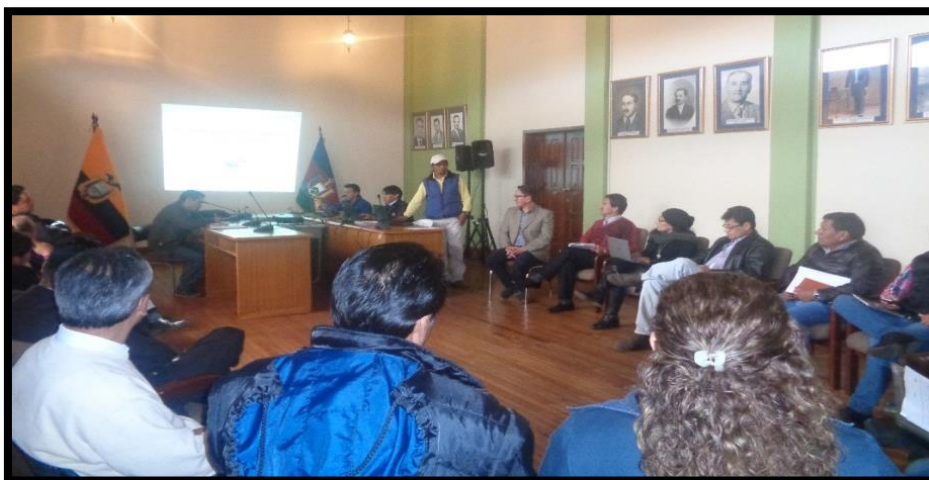
Reunión de constitución y activación del Consejo cantonal de Seguridad

Con el objetivo de coordinar, articular y fortalecer la gestión de la seguridad ciudadana en el cantón, se activa el Consejo Cantonal de Seguridad Ciudadana de Pedro Moncayo CCSCPM, como “organismo especializado, cuya función es planificar, estudiar, coordinar e integrar a los diferentes actores políticos, públicos y privados del Cantón” , reconocido mediante ordenanza aprobada a fines del 2014. Evento que se realizó en la sala del concejo municipal, el 22 de junio del 2016, con la participación de más del 98% de representantes, acordándose continuar planificando actividades de acuerdo a la ordenanza vigente.