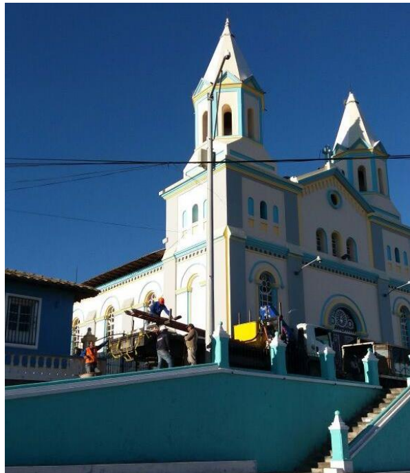
Cámara video vigilancia ("ojos de águila") instalada en el Parque central de la parroquia La Esperanza