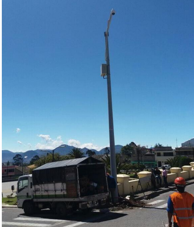
Cámara video vigilancia ("ojos de águila") instalada en el Parque central de la parroquia Malchinguí.