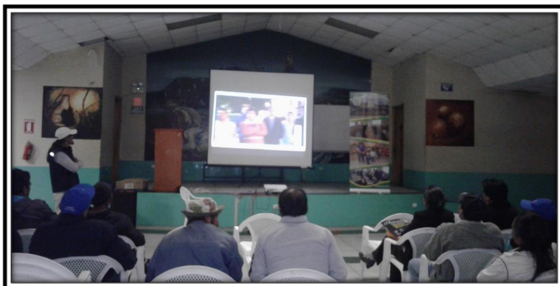
Taller de Seguridad con Brigadistas y Autoridades de Malchinguí

Cabe señalar que los puntos tratados giraron en torno a 2 temas principales: por un lado la identificación y análisis participativo de la situación de seguridad de la parroquia y por otro, la socialización del evento “Pedro Moncayo Listo y Solidario” co-organizado por la señorita Reina del cantón y la Alcaldía, con el fin de generar y recaudar fondos o recursos económicos para ser canalizados hacia las zonas afectadas por el terremoto. En síntesis, y como resultado de este primer taller en esta parroquia rural, se resalta los compromisos de, por un lado avanzar hacia la conformación del Consejo de Seguridad Parroquial de Malchinguí en las siguientes semanas y por otro lado apoyar como brigadistas ciudadanos en las tareas de brindar seguridad en el Concierto Solidario con el artista chileno “Américo” a realizarse el día sábado 04 de junio. En dicho taller se contó con la participación de 24 personas entre brigadistas, el Presidente de la Junta Parroquial y la Teniente Política.