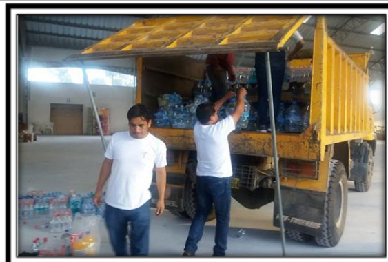
Alistando y cargando el agua para el viaje a la provincia de Manabí.