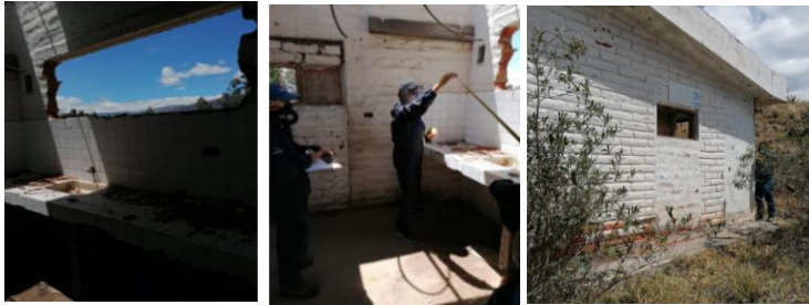
Fotografía 3. Medición técnica del lote de terreno de aproximadamente 7000 m 2 en el sector de Puruhantag de la Parroquia Tabacundo