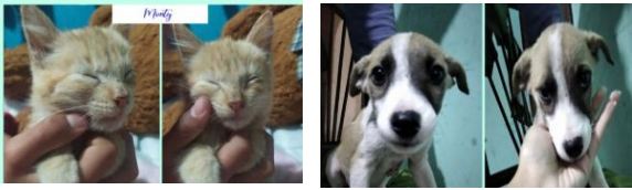
Fotografía 1. Informe de Actividades realizadas de Control Sanitario de Fauna Urbana Plan Operativo Anual: 01/01/20-31/12/20.