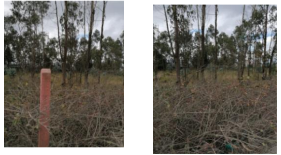
Fotografía 4. Área verde municipal que fueron dejados como espacios verdes, donde se define un lugar estratégico para poder instaurar ahí el albergue para el proyecto en la Parroquia de Malchinguí.