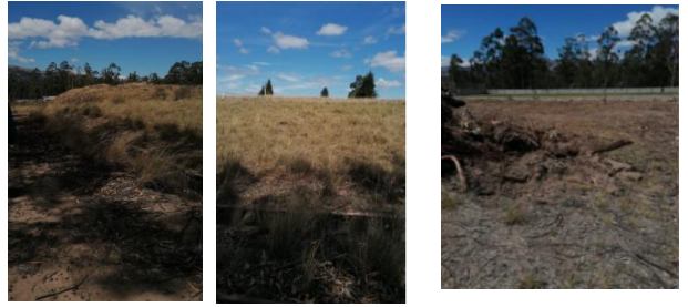
Fotografía 2. Área o lote de terreno de aproximadamente 7000 m 2 en el sector de Puruhantag de la Parroquia Tabacundo.