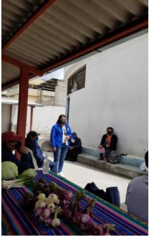
Fotografía 3. Capacitación sobre Primeros Auxilios a la Feria "Buen Vivir"