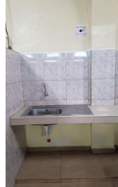
Fotografía 6. Acta entrega recepción del local N° 9 de comidas Mercado Municipal.