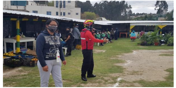
Fotografía 2. Capacitación sobre Primeros Auxilios a la Feria UCCOPEM