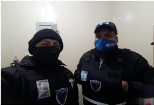
Fotografía 5. Seguridad en el Mercado Municipal del cantón Pedro Moncayo