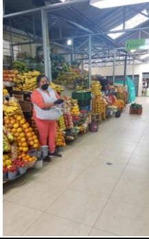
Fotografía 1. Disponibilidad de frutas en el Mercado Municipal