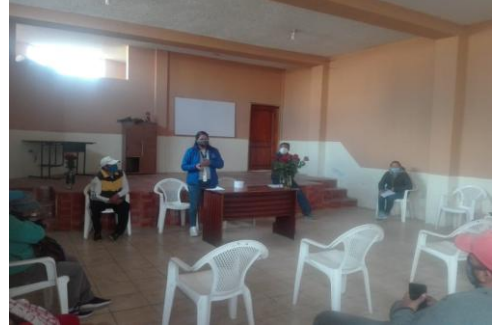
Fotografía 4. Capacitación sobre Primeros Auxilios a la Feria la "Y" Unidos por un Progreso