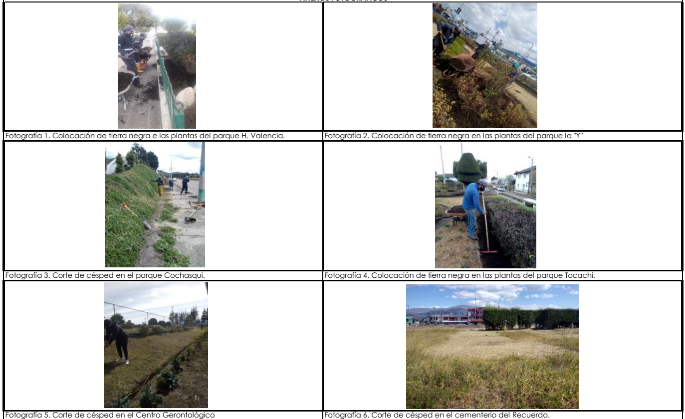
Fotografía 5. Corte de césped en el Centro Gerontológico