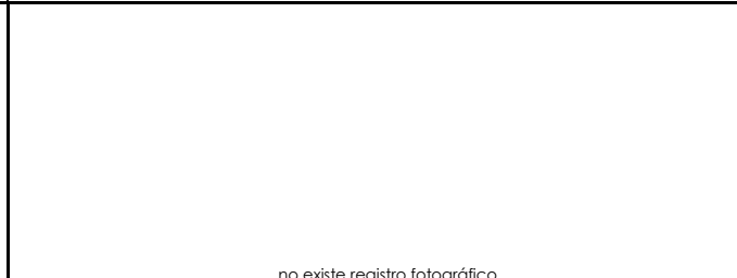
Fotografía 4. alfabetizacion digital