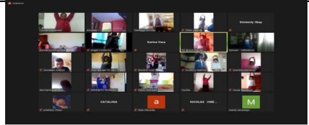
Fotografía 2. colonias vacacionales