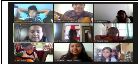
Fotografía 3. colonias vacacionales