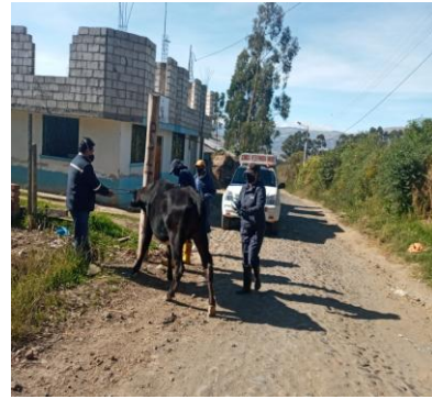
Fotografía Vacunación ganado vacuno para vitamizar y desparasitar, en distintas zonas de Pedro Moncayo