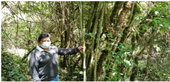
Fotografía 3. Asesoramiento técnico a emprendedores Turísticos en Malchingui