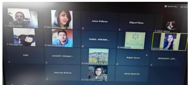
Fotografía 4. Trabajo mancomunado entre el GAD Municipal de Pedro Moncayo y Cayambe, GAD Provincial y actores de turismo. En la construcción de una ruta turística que va a los dos cantones