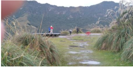
Fotografía 1. Actividades en el atractivo natural Laguna de Mojanda, información turística, guía y demás normas de bioseguridad a turistas del patrimonio,