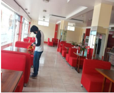
Fotografía 3. Apoyo en la grabación de videos promocionales "CAMPAÑA REACTÍVATE TURISMO" en coordinación, con estudiante de la Universidad Central del Ecuador- Vinculación con la Sociedad