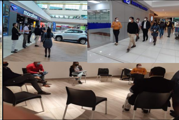
Fotografía 4. Reunion de trabajo y coordina con representantes del centro comercial el portal