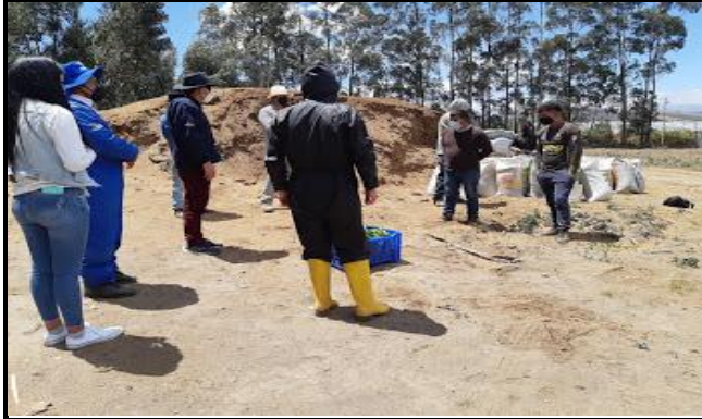
Fotografía 3. Entrega de Abonos y plántulas a los productores y comuni de la UCIBT,