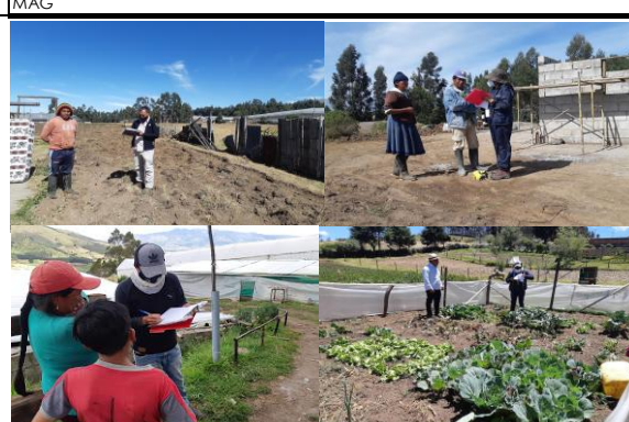
Fotografía 8. Actividades de coordinación y apoyo para el levantamiento de información con la fundación COAGRO.