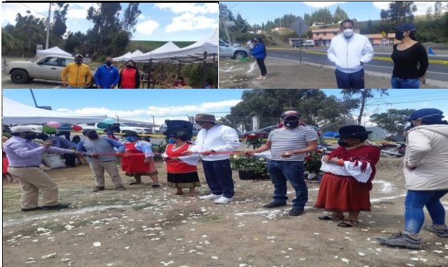
Fotografía 1. Apoyo y coordinación con la feria comunitaria de Ñañaloma