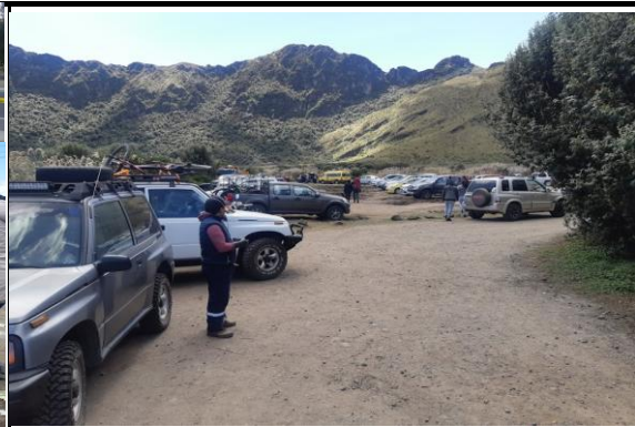
Fotografía 2. Apoyo en la reactivación de visitantes a las lagunas de mojanda