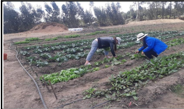
Fotografía 5. Actividades en la granja experimental demostrativa de Puruhuantahg