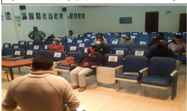
Fotografía 7. Reuniones de Trabajo y coordinación con los pequeños y medianos productores y exportadores florícolas.