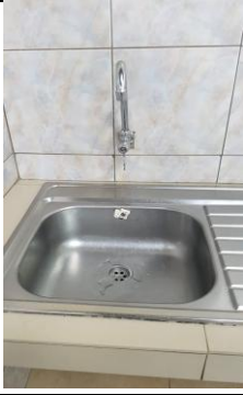
Fotografía 5. Acta entrega recepción del local No CM - 007, sección COMIDAS