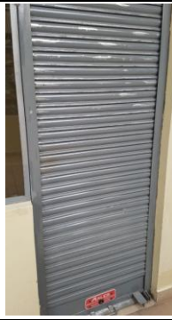
Fotografía 6. Acta entrega recepción del local N°AL-001 sección ALMACENES del Mercado Municipi