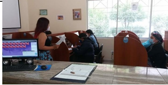
Fotografía 2. evaluación de proceso de selección de junta protectora de derechos.