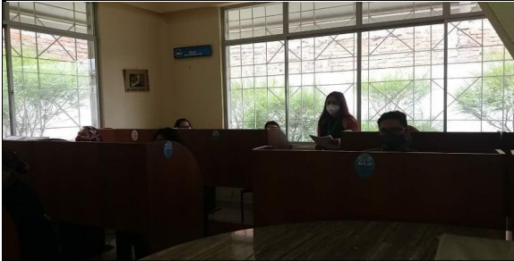
Fotografía 1. evaluación de proceso de selección de junta protectora de derechos.