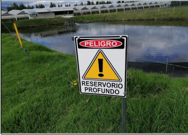
Fotografía 1. Verificaciones de planes de emergencias y desastres