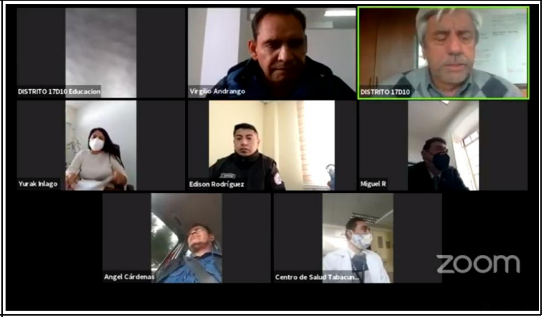
Fotografía 2. Reuniones del COE Cantonal