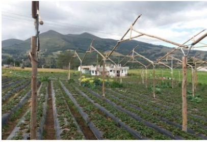
Fotografía 3. Inspección en la comunidad de Agualongo