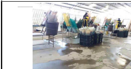
Fotografía 1. Inspección Florícola Arbusta