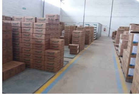
Fotografía 6. Inspección a la empresa Solagro