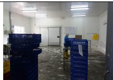
Fotografía 2. Inspección Cepaproducciones