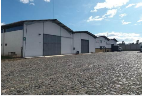
Fotografía 5. Inspección de la empresa Ecuaservicios