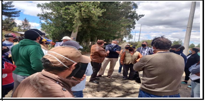
Figura 2.- Inspección de Control Ambiental