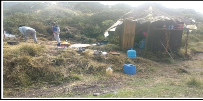
Figura 1.- Control de actividades antrópicas en la Zona Lacustre Mojanda.