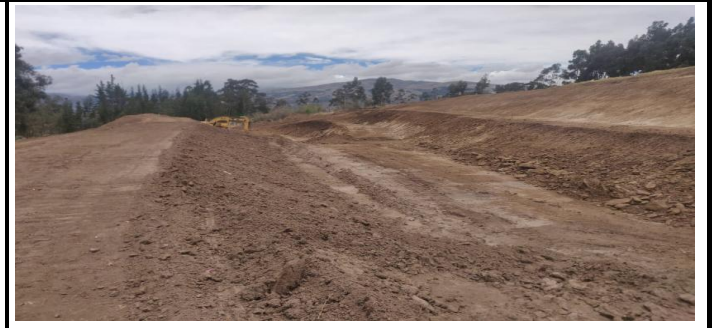
Fotografía 4.- Inspecciones a denuncias.