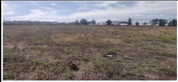
Figura 2.- Inspecciones de uso de suelo