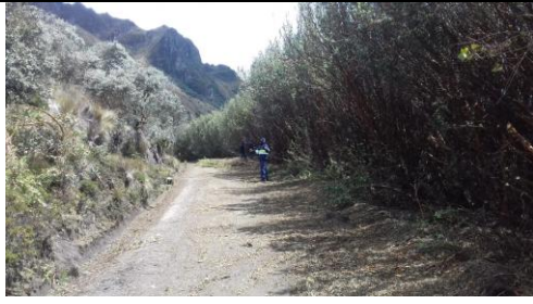
Fotografía 5. Poda de árboles vía las lagunas