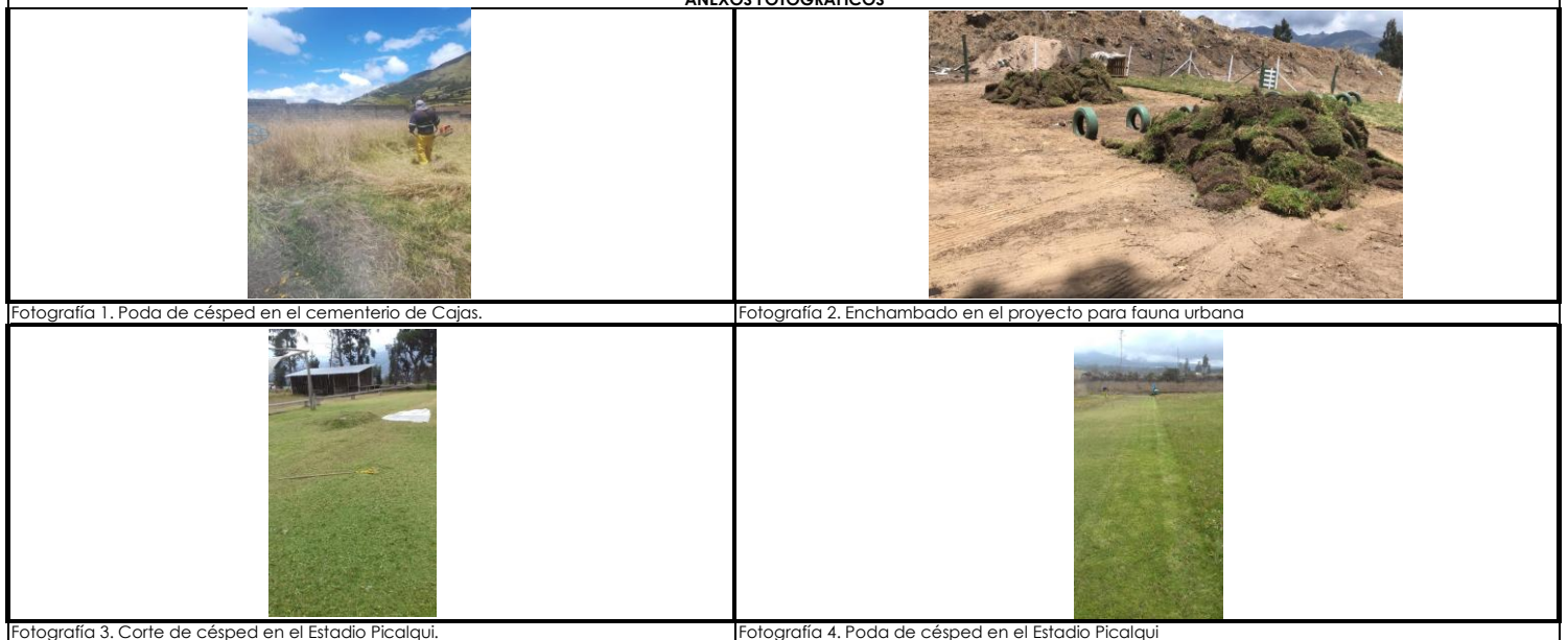
Fotografía 1. Poda de césped en el cementerio de Cajas.