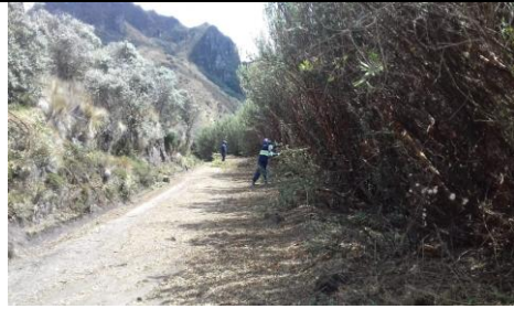
Fotografía 6. Poda de árboles