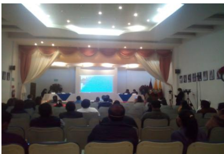
Deliberación Proceso de Rendicion de Cuentas 2019