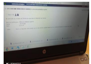
Confirmación del CPSC Rendición de Cuentas del señor Alcalde