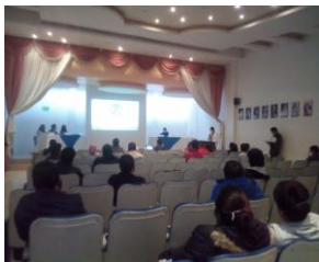
Reunión de Seguridad Ciudadana