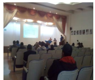
Presentación del Anteproyecto de Presupuesto