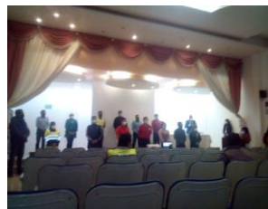
Conformación del Consejo de Seguridad Ciudadana